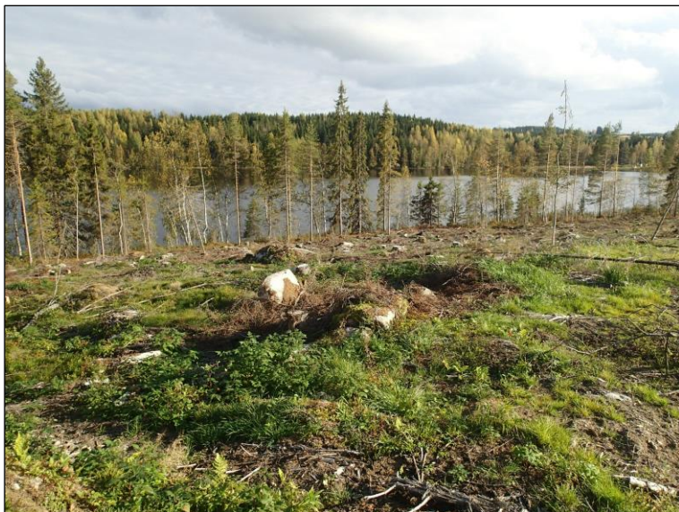
Pörsän eteläosan länsirantaa