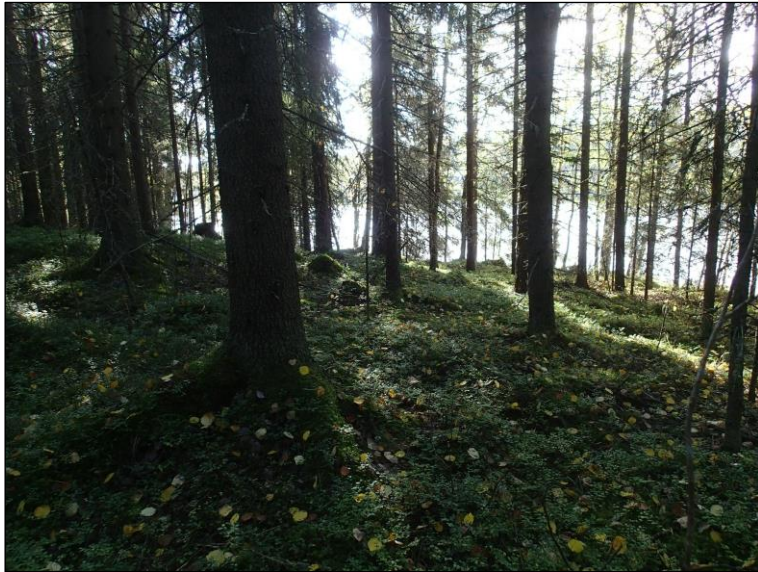
Ruotaanjärven eteläpään itärantaa