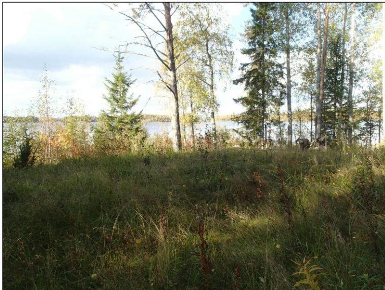
Lampaanjärven rantaa Kyllösenniemessä.