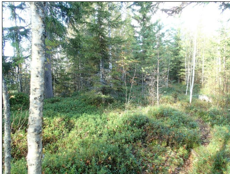
Lampaanjärven rantaa Konttiniemen pohjoispuolella